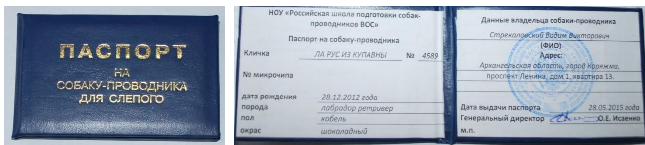
Рисунок 2. Образец паспорта собаки-проводника для незрячего инвалида.

Следует проверить наличие у инвалида с собакой паспорта собаки-проводника для незрячего (документ, подтверждающий ее специальное обучение). Образец действующего паспорта (рис.2):